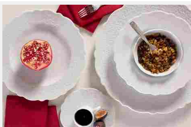
Alessi, servizio Dressed

La tavola total white , con pizzi e merletti , sembra proprio quella di una sposa. Allora per ricreare la magia di quel momento, usiamola anche a colazione , anche solo per un caffè, un frutto, una tazza di cereali... Con questo abito prezioso ci sentiremo di nuovo in luna di miele.