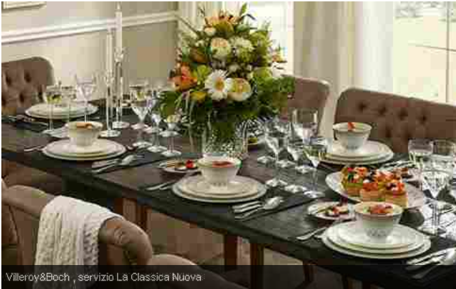
Villeroy&amp;Boch, servizio La Classica Nuova

Chi l'ha detto che piatti da portata speciali, calici in cristallo e decori preziosi vanno riservati solo alla tavola delle grandi occasioni? Certo una mise-en-place elegante e ricercata va curata nei dettagli (e non sempre abbiamo il tempo per farlo), ma in fondo perché non prendere spunto dallo stile sofisticato dei pranzi più importanti, per ricreare nel quotidiano la stessa atmosfera chic e un po' leziosa? In fondo non è così impegnativo. E vuoi mettere il risultato di mangiare una semplice insalata in un piatto dai bagliori platinati? Allora, se l'idea vi alletta, ecco tre suggerimenti "facili" per illuminare la tavola di tutti i giorni e regalarle un'allure speciale.