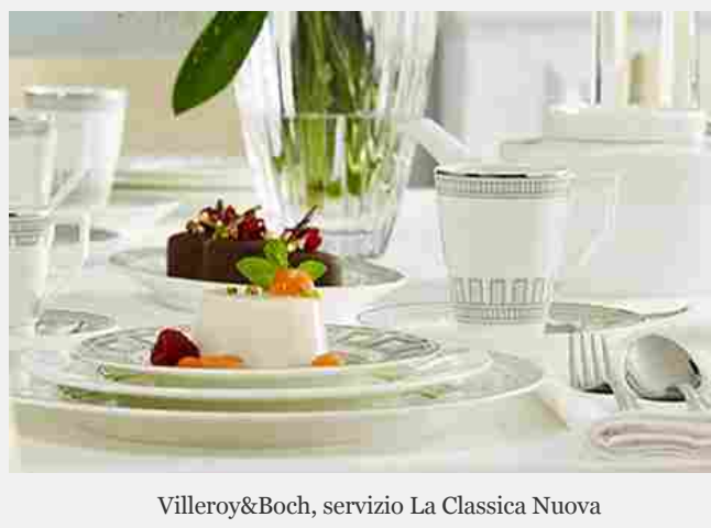
Villeroy&amp;Boch, servizio La Classica Nuova

Anche se i piatti con profili in platino o a motivi floreali vi sembrano già troppo "impegnativi", non ripiegate sui soliti piatti lisci e bianchi. Noi ci siamo innamorati di questo servizio, rigoroso e lineare, ma che con il suo decoro geometrico richiama subito l' eleganza dello stile italiano . Semplice e chic.