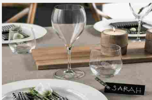
RCR Cristalleria Italiana, servizio The Only One

Stai pensando di ristrutturare casa? Questo è il momento giusto!